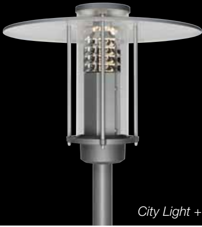
City Light +