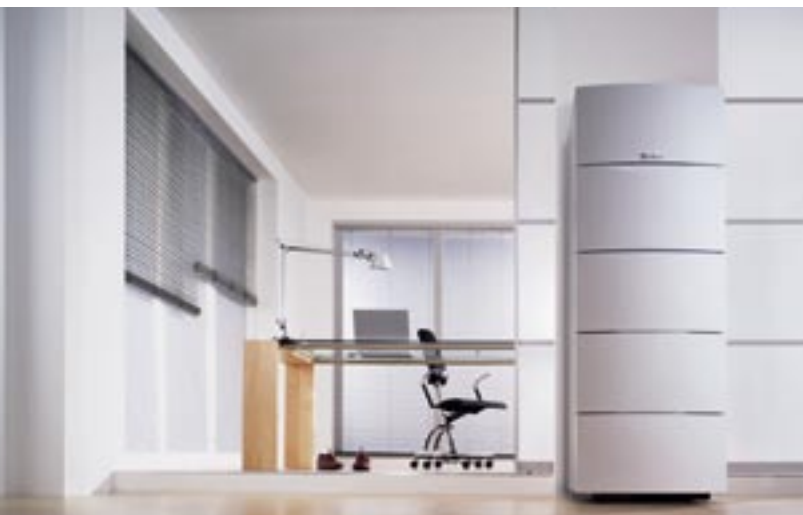
auroCOMPACT kondenserende solvarmeunit