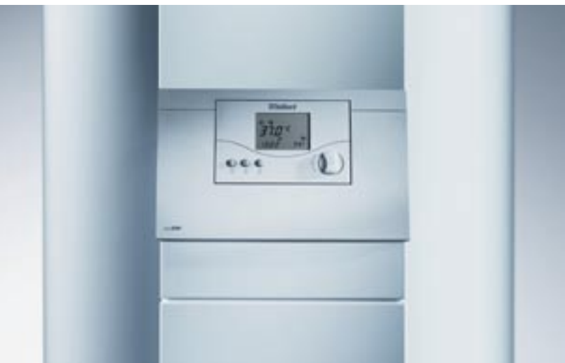
auroSTEP solvarmebeholder med indbygget styring